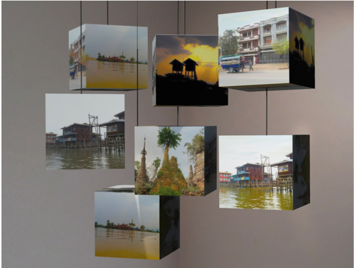
Souvenirs de Birmanie