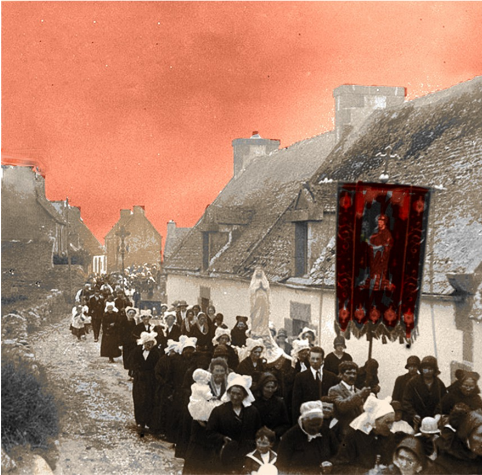
La Troménie de Locronan

Pour ce projet joint entre la France et les Etats Unis, François de Verdière a travaillé sur des images très anciennes de pardons bretons (processions et fêtes) en mettant en valeur la ligne noire et blanche des thèmes anciens et la couleur apportée par la création numérique pour dramatiser les scènes.